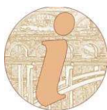
Ordine degli Ingegneri della Provincia di Ragusa